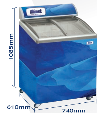
CV-200ICA Conservadora inclinada con tapas deslizables de vidrio curvo templado de baja emisividad con llave.