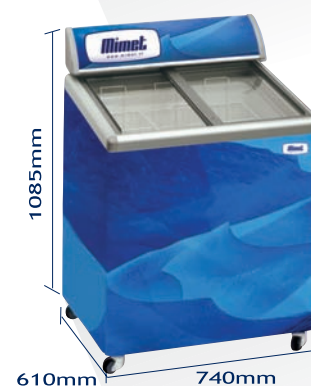
CV-200IA Conservadora inclinada con tapas deslizables de vidrio templado de baja emisividad con llave.