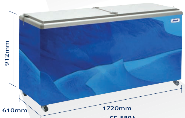
CF-580A Conservadora recta con tapas sólidas de lámina de acero prepintado con asilación de poliuretano inyectado y porta candado de acero inoxidable.